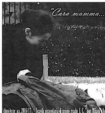
classi terze a.s. 2016/17 - Scuola secondaria di primo grado I. C. "don Milani" Arcore