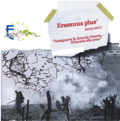
Manuel pédagogique et didactique

ENSEIGNER LA GRANDE GUERRE EDUQUER A LA PAIX