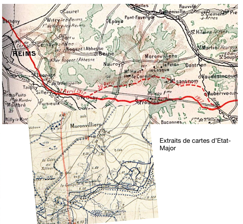
Extraits de cartes d'Etat-Major