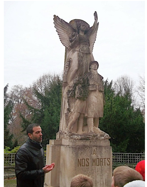
Monument aux morts du lycée

La nécropole nationale de Sept-Saulx (Marne) Située à 18 kilomètres au sud-est de Reims c'est là qu'est enterré Paul de Glandières. 3 043 soldats français tués au cours de la 1 ère guerre mondiale y sont inhumés.